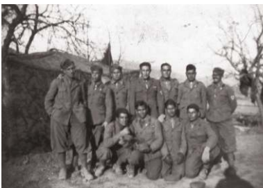
Arxiu de Tradicions de l'Alguer. Autor desconegut. Patrulla de soldats feixistes italians en territori espanyol el dia abans d'anar cap al front de Teruel. Sense localitzar, 1938