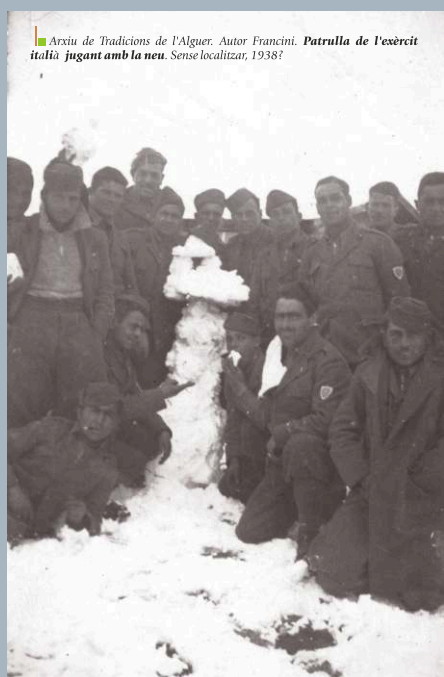
Arxiu de Tradicions de l'Alguer. Autor Francini. Patrulla de l'exèrcit italià jugant amb la neu. Sense localitzar, 1938?