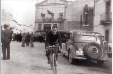
Arxiu Històric Comarcal de Sant Feliu de Llobregat. Autor Lluís Tort i Guàrdia. Miting polític en plena Guerra Civil realitzat al Casino Santfeliuenc, seu del Centre Republicà Català Federal, adherit a ERC. Sant Feliu de Llobregat (Baix Llobregat), 1937