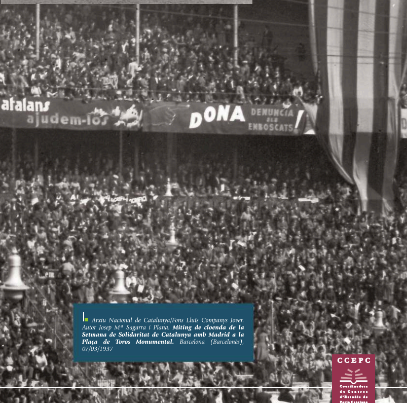
Arxiu Nacional de Catalunya/Fons Lluís Companys Iover. Autor Josep M a Sogarra i Plana. Miting de cloenda de la Setmana de Solidaritat de Catalunya amb Madrid a la Plaça de Toros Monumental. Barcelona (Barcelonès), 07/03/1937