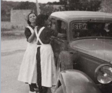
Joves voluntaris, majoritàriament nates joves de La Senia. La Senia, 1938