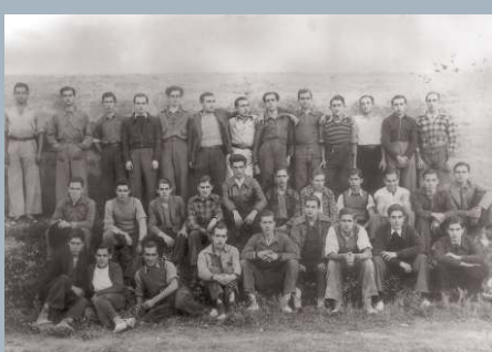
Grup de santfeliuencs i de santjoanencs de la lleva de 1940 que van ser cridats per fer la instrucció militar durant la Guerra Civil, abans d'incorporar-se al front. La instrucció la feren al camp de futbol del Pineda i foren instruits per un capità basc. Sant Feliu de Llobregat (Baix Llobregat), 1938