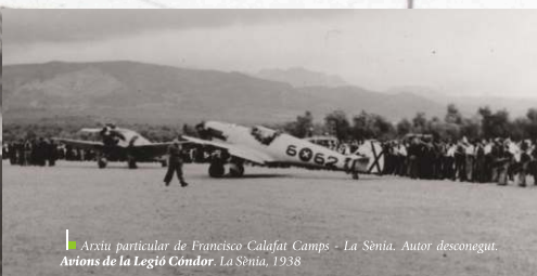
Avions de la Legió Cóndor. La Senia, 1938