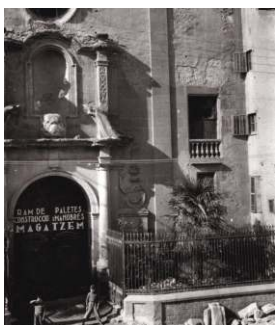
Arxiu Històric Comarcal de Vic. Autor desconegut. Església del Carme incautada com a magatzem pel ram dels palletes de la construcció i manobres, durant la Guerra Civil. Vic (Osona), 10/02/1937